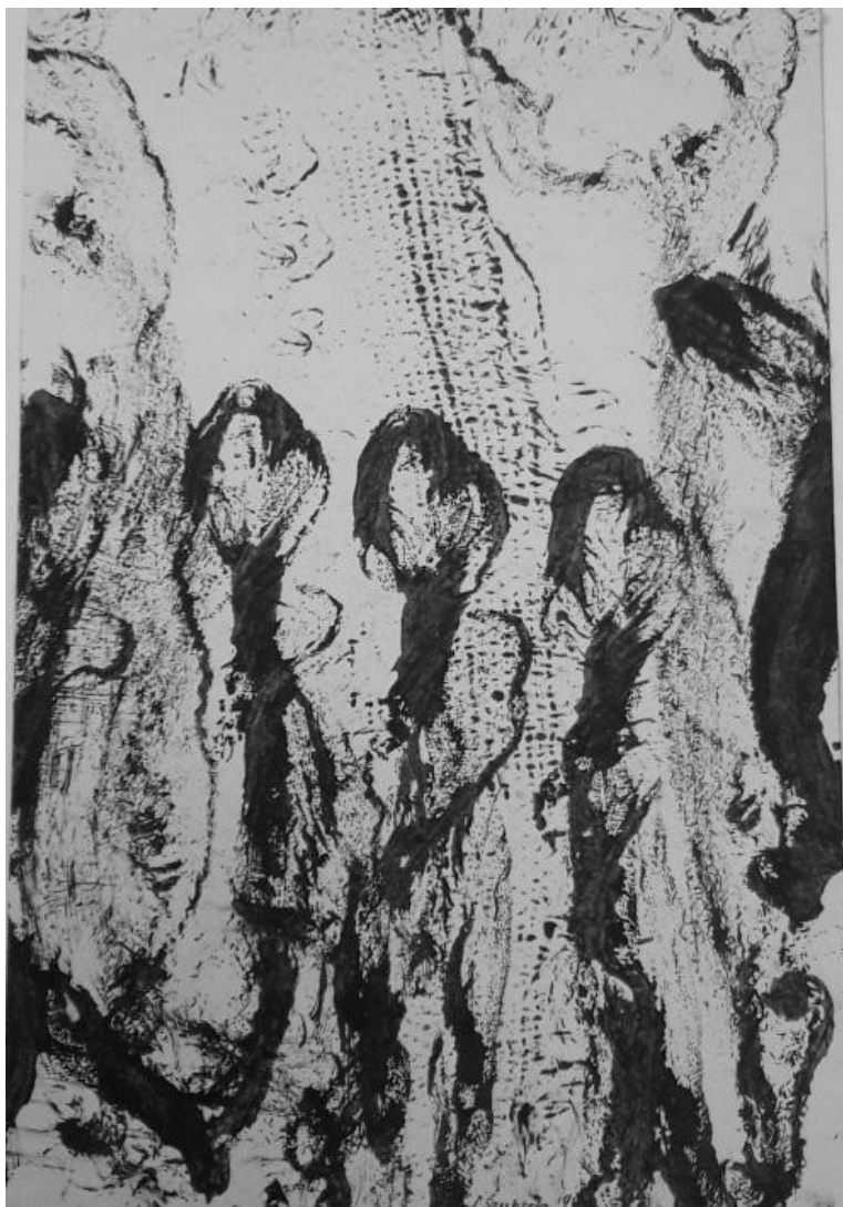
Ilustracja 3: Frotaż. Przedstawia grupę ludzi w zarysie, czarno - biała praca.