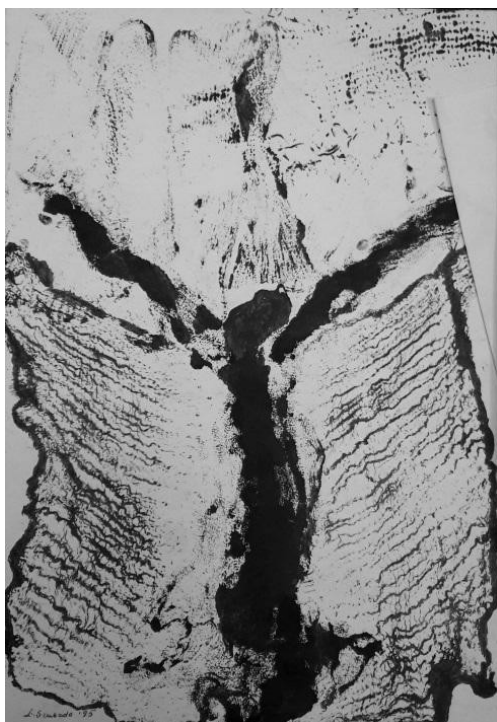
Ilustracja 1: Frotaż. Zarys wizerunku Jezusa na krzyżu.