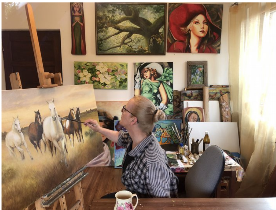
Ilustracja 1: Malarka w swojej pracowni maluje obraz stado koni.