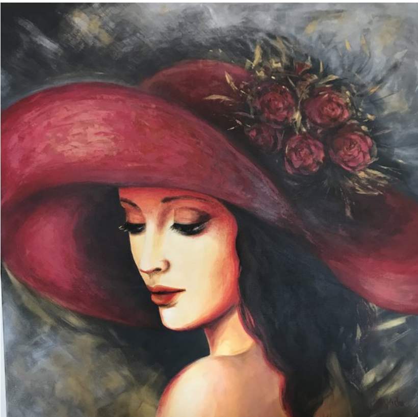
Ilustracja 4: Portret kobiety w czerwonym kapeluszu.