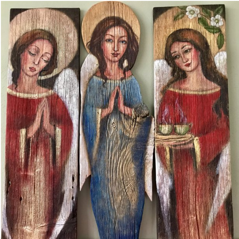
Ilustracja 3: Trzy anioły namalowane na desce.