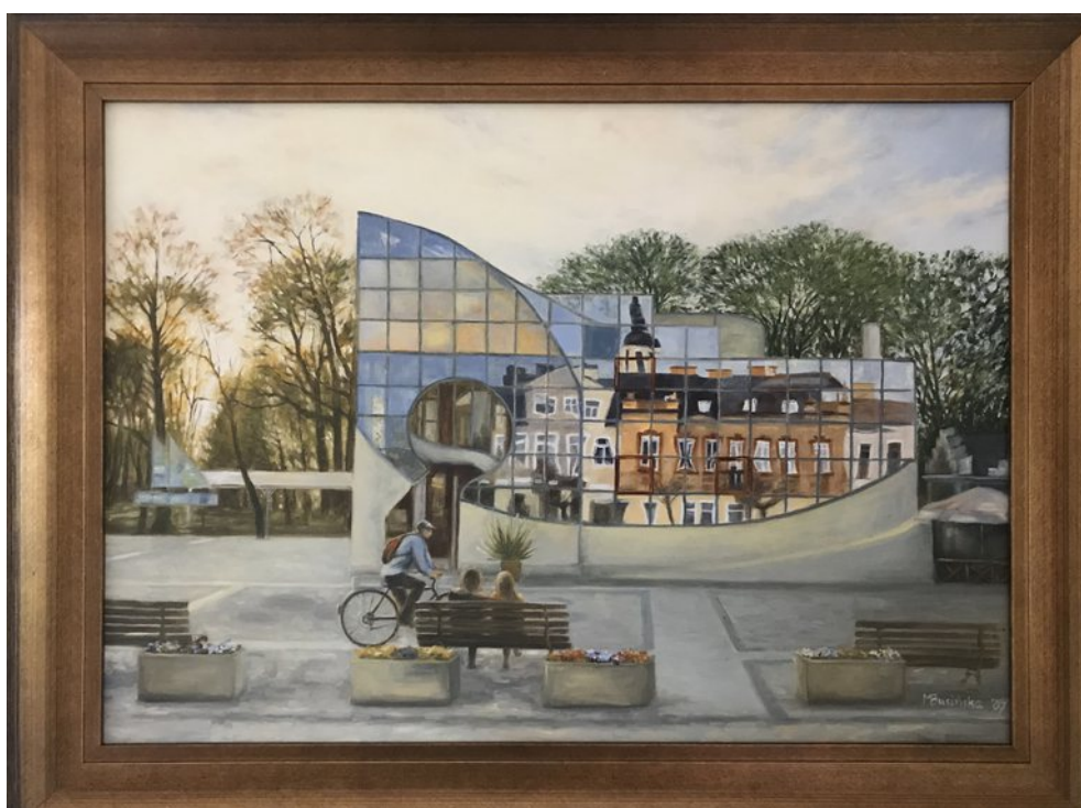
Ilustracja 2: Obraz przedstawia budynek znajdujący się na Rynku Zygmunta Augusta. W oknach odbijają się wieże Bazyliki NSJ i kamieniczki.